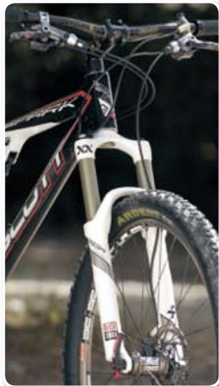
▲有油壓線控設計的 REBA XX 避震前叉。

鏈，並提供 31.8、34.9、38.1 三種尺寸的 Low Clamp 或 High Clamp 鎖固束子，另有直接鎖入式（Direct Mount）可選。後變速器則完美搭配碳纖維長腿、鋁合金外連桿以及鎂合金內連桿，締造出僅 181g 的輕盈重量。變速撥桿則結合碳纖維以及複合材料，握距可調，僅 183g，可搭配 XX 專用的 MatchMaker X 轉接座束子設計，將煞車、變速以及避震調整三個功能整合於同一側。