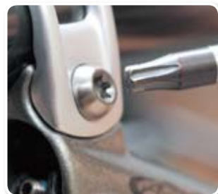
▲整組 XX 的螺絲孔都統一用梅花形的 Torx T25，只要一支工具就能微調到底，非常 smart！

XX 套件專用的避震前叉又有三支：SID XX（行程 100mm）、Reba XX（行程 100/120mm）以及 Revelation XX（行程 140mm），皆有全新的油壓線控設計，以及新增 Sag 的刻度標示，車手不用那麼麻煩再看對照表調整 Sag，只要看刻度即可，一般建議打到中間的 20% 即可。最令人讚賞的是整組 XX 的螺絲孔都統一用梅花形的 Torx T25，所以全部微調一支工具到底就能完成，非常貼心。