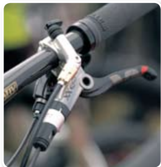
▲獨家煞車、變速與避震撥桿三合一的設計。