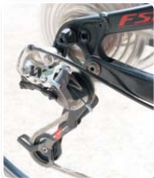
▲結合碳纖維、鋁合金與鎂合金的 XX 後變。

爲了讓變速更迅速有效率，僅 118g 的 XX 前變有特殊內凹造型設計，可快速上