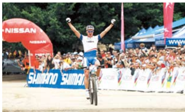
▲Julien Absalon 使用最新 XX 套件贏得世界盃登山車賽馬德里站冠軍！

9 月之後將陸續上市的 XX 套件成車，包括 Specialized、Scott、Giant、Merida 等等，XX 套件的台灣售價尚未公佈，國外報價約 US$3,300 起跳（含避震前叉）。🌀