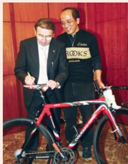
▲彰化高登車行老闆牽出Colnago CF7紀念車款請Ernesto Colnago簽名。

奕，每年總能在全球各大大自行車展會看見他的身影。今年他也親自到訪台北自行車展，並在展會首日晚間，應 Colnago 台灣總代理三司達公司之邀，和台灣各地經銷車店的老闆們一起進行晚宴。