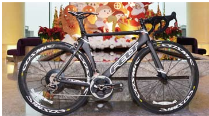
▲►Felt AR系列與F系列公路車，符合臺灣騎乘者需求。