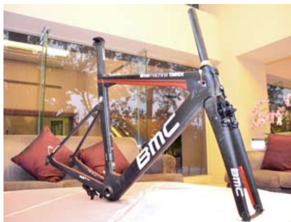
▲Time Machine TMR01提供騎乘者破風感受，並且剛性也能達到競賽等級需求。