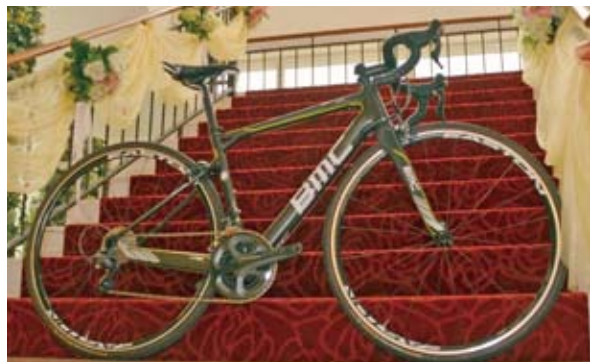
▲BMC Racing Team 2013年最新推出的GranFondo GF01，適合長時間騎乘，為BMC Racing Team訓練用車。