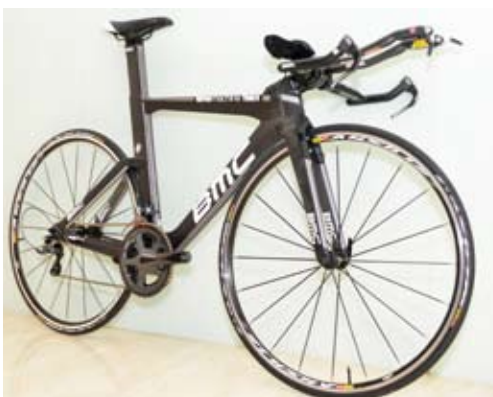
◀▲讓消費者有多元選擇，達鉦將 BMC 三鐵計時車 TimeMachine TM01、29吋登山車TeamElite TE03 29 帶入臺灣。