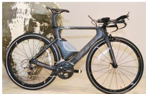
▲Felt DA系列三鐵計時車，提供低風阻特點。