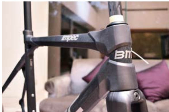
▲BMC Impec推出霧黑版，同時相容Di2系統。

BMC 針對 TM 系列車款，透過研發部門嚴格把關，讓車款能符合高剛性、輕量化與速度感，同時考量騎乘者對於三鐵車的舒適感需求，特別提供墊片，讓騎乘者可依造自身需求，來調整車架前方、座墊調整扣環、車手高度及頭管長度，最多可調整 128 種騎乘姿勢。29 吋登山車 TeamElite TE03 29 也是 BMC 主推商品，在全球 29 吋車種仍有需求下，達鉸特別將 TeamElite TE03 29 帶入臺灣，提供消費者多元選擇，同時為延引產品線，並讓使得青少年也能擁有一輛專屬自己的自行車，達鉸也將 2013 年 BMC 新品 Blast 帶進臺灣，期望能透過 20 吋或 24 吋及較低中管設計特點，讓青少年在操控性上更加容易，同時也增加騎乘安全的穩定性。