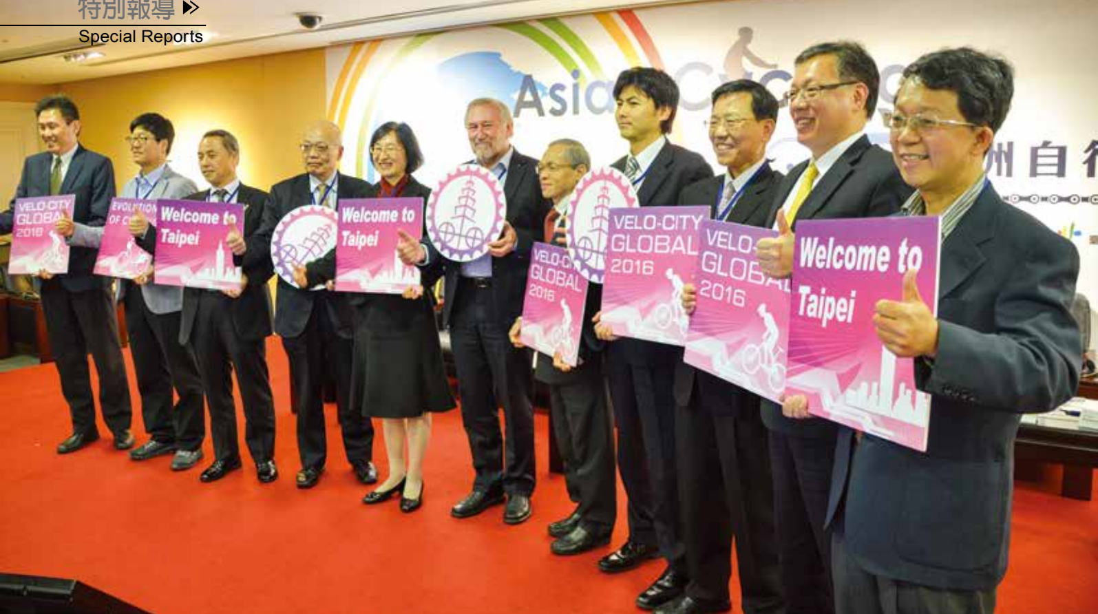
▲論壇的尾聲，貴賓們舉起「Velo-city Global 2016」看板，歡迎各國貴賓能參與2016年將在台北市舉辦的全球自行車城市大會。

費考量的不足等。而日本愛媛縣也在島波海道舉辦國際自行車大會，將整條高速公路封閉，讓各國自行車手享受由九座橋連結的六個島嶼風光，結合當地特色景點和大規模的國際活動，吸引國外觀光客。