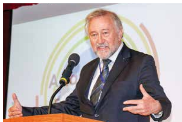
▲歐洲自行車聯盟主席Manfred Neun親臨論壇現場，分享歐洲城市的自行車發展經驗。

交通部現正進行的環島自行車道試辦計畫，預計將在今年年底前完成，規畫的原則以考量路線的安全性、連續性、友善性與直截性為主，包括採用日本島波海道的自行車標線，在路面上標示鮮明的指示線，不只能指引環島路線，也可以讓其他用路人注意、甚至禮讓自行車騎士，除此之外，也將 21 個台鐵車站設為兩鐵轉運車站，以作為各地區民眾環島路線的出發點，或是分段環島的起、迄轉運站，並提供路線資訊和維修補給等服務，希望藉由友善的設計來更貼近民眾生活，積極打造台灣成為自行車生活島。