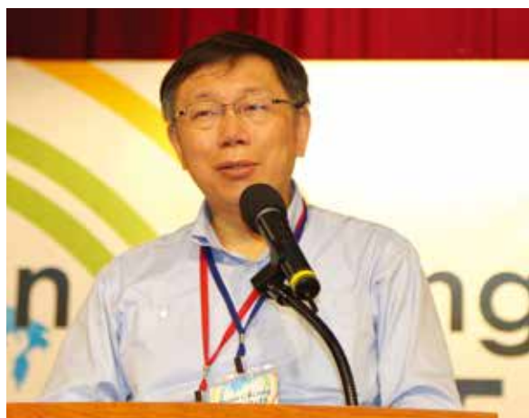
▲台北市長柯文哲在開幕致詞時表示「只有更好，沒有最好」，希望藉由此國際性論壇，把世界的經驗帶進台北市，讓台北的自行車運輸能做到更好。

色建築、智慧城市及永續經營是全世界最蔚為流行的觀念，而自行車是完全符合這種價值的工具。台北市政府一直都把自行車